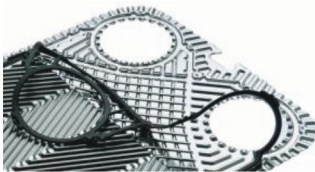
Пластины и уплотнения для теплообменников