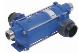
Теплообменники - нагреватели для бассейна