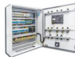
Автоматика теплового пункта

Нужна помощь в подборе оборудования - ОСТАВЬТЕ ЗАЯВКУ, МЫ ПОМОЖЕМ