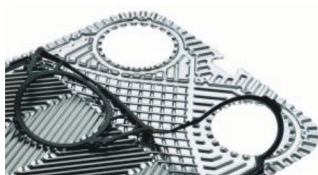
Пластины и уплотнения для теплообменников