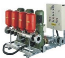
Насосы и насосные станции