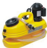
Все для промывки теплообменников