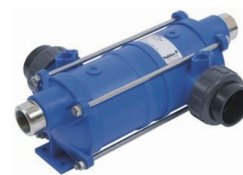
Теплообменники - нагреватели для бассейна