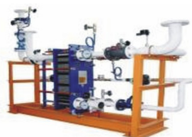
Тепловые пункты ИТП, ЦТП, БТП